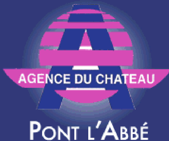
Photo bientôt disponible